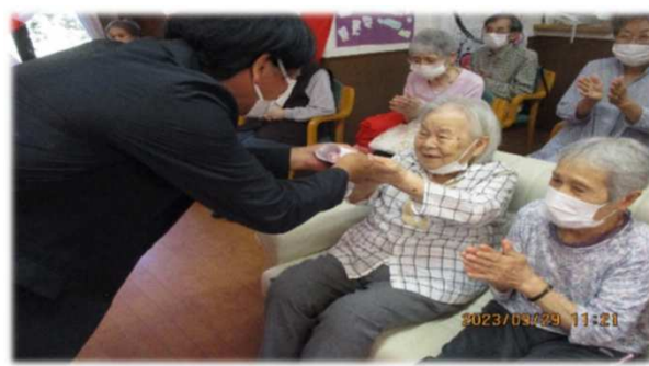
これからも元気で長生きしてくださいね！