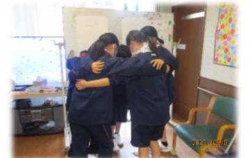
円陣組んで「エイエイオー！」