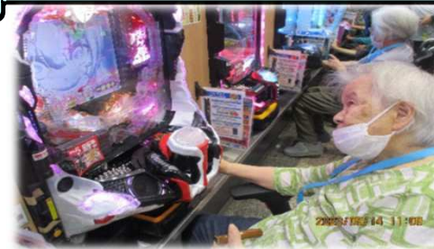
数字がそろった！ 大当たり！！