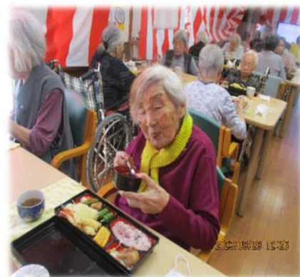
お弁当美味しいな～！！