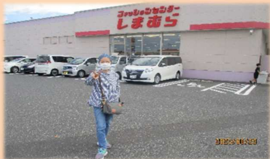
「似合う服が見つかるかな？」