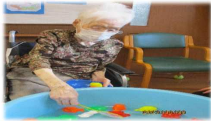
どれすくうか迷うな～