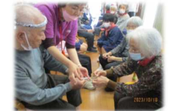
新聞網引き 慎重に慎重に...