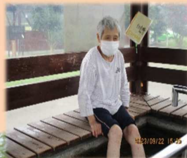
散歩の後は足湯で一息「疲れがとれるわ～」

ご利用者様の「～したい」を実現し、一人一人にスポットをあてた支援を行っています。