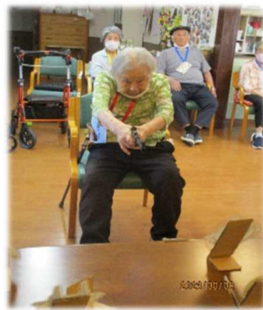
狙いを定めて「あたれ！」