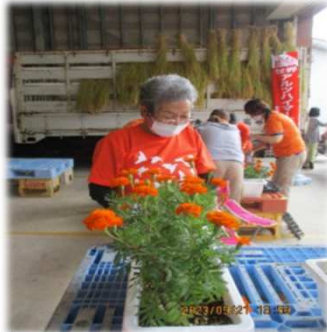
マリーゴールドの苗を倉吉農業高校の生徒さんと一緒に植えました！