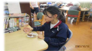
おやつにチョコバナナ「おいしい！」