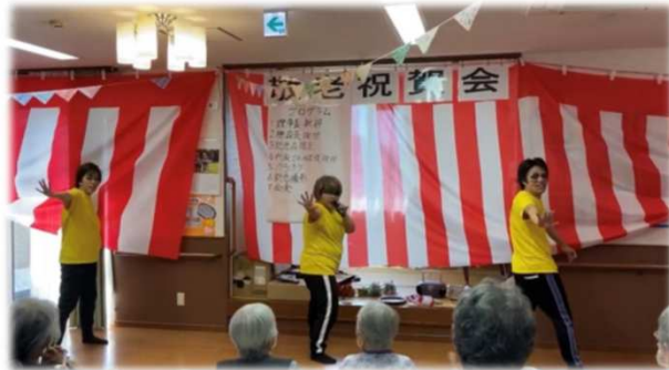
職員によるダンス「女々しくて」