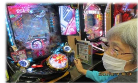
そろそろ当たりそう...