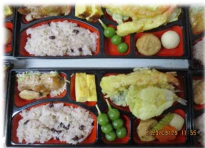
手作りで愛情いっぱいの昼食です！