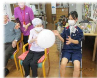
風船リレー「白組速い！」