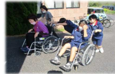
坂道で車椅子「意外と重い？」