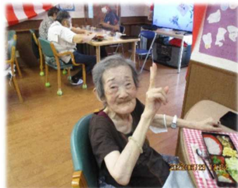
あまりのおいしさにこの笑顔！