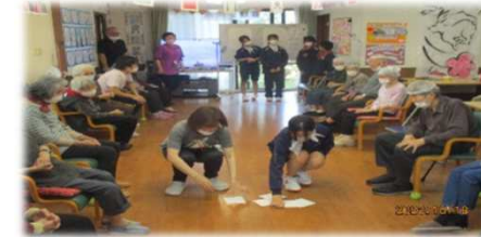
☆借り物競争☆ 職員VS中学生！職員の完敗でした...